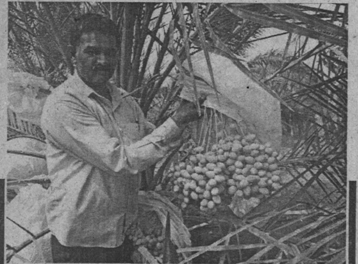
નયારાએનર્જી લિ.ના સહયોગથીમીઠોઈ ગામના ખેડૂતે જૈવિક ખેતી અંતર્ગત ખારેકનાપાકનું મબલખઉત્પાદન કરી ખેતીનીઆવકમાં નોંધપાત્ર વધારો કર્યો છે.

જામનગર તા.૨૪: નયારા એનર્જી લિ.એ હાથ ધરેલા ઔદ્યોગિક સામાજિક જવાબદારીના અભિયાન થકી મીઠોઈ ગામના ખેડૂતે જૈવિક ખેતી અંતર્ગત ખારેકના પાકનું મબલખ ઉત્પાદન કરી ખેતીની આવકમાં નોંધપાત્ર વધારો કર્યો છે. ખેડૂતને તાલીમ, રોપા, માર્ગદર્શન અને ઉત્પાદિત પાકના વેંચાણમાં પણ કંપનીએ સહયોગી બની મીઠોઈની મીઠી ખારેકને પંથકમાં વિખ્યાત કરી દીધી છે. નયારા એનર્જી લિ. દ્વારા રિફાઈનરની નજીકના ગામોના ખેડૂતોને જૈવિક ખેતી થકી વધુ આવક થાય એ માટે અભિયાન હાથ ધરવામાં આવ્યું છે, આ અભિયાનની સફળતાનાં ફળ ખેડૂતોને મળી રહ્યાં છે. જેનો નોંધપાત્ર દાખલો જોઈએ તો રિફાઈનરની સામે