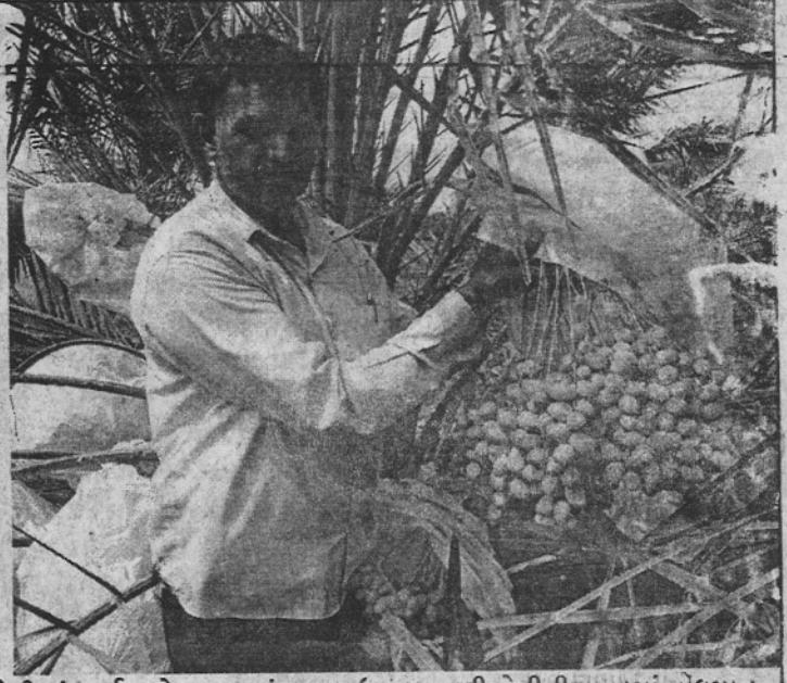
નયારાએનર્જી લિ.ના સહયોગથીમીઠોઈ ગામના ખેડૂતે જૈવિક ખેતી અંતર્ગત ખારેકનાપાકનું મબલકઉત્પાદન કરી ખેતીનીઆવકમાં નોંધપાત્ર વધારો કર્યો છે.

જામનગર, નયારા એનર્જી લિ.એ હાથ ધરેલા ઔદ્યોગિક સામાજિક જવાબદારીના અભિયાન થકી મીઠોઈ ગામના ખેડૂતે જૈવિક ખેતી અંતર્ગત ખારેકના પાકનું મબલક ઉત્પાદન કરી ખેતીની આવકમાં નોંધપાત્ર વધારો કર્યો છે. ખેડૂતને તાલીમ, રોપા, માર્ગદર્શન અને ઉત્પાદિત પાકના વેચાણમાં પણ કંપનીએ સહયોગી બની "મીઠોઈની મીઠી ખારેક"ને પંથકમાં વિખ્યાત કરી દીધી છે.